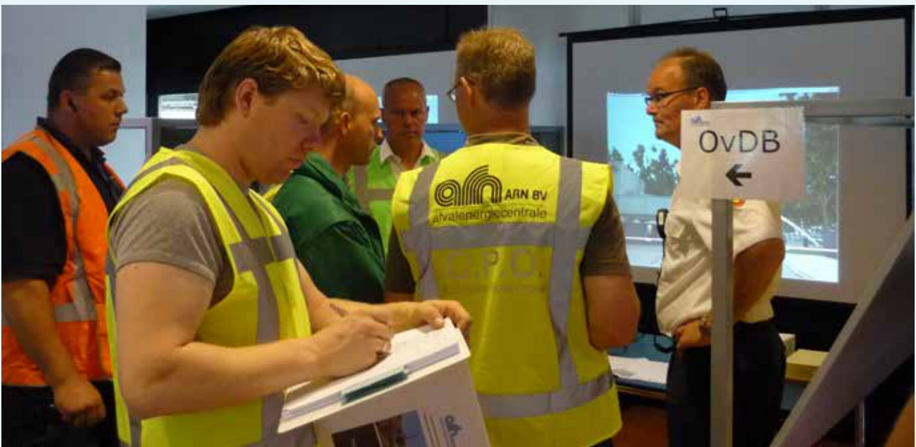
Oefening met brandweer, politie, ambulance en Waterschap

Vanuit ons managementteam hebben de bedrijfsleiders Operations en Onderhoudsdienst om beurten consignatiedienst. Zij kunnen in voorkomende gevallen uiteraard ook direct contact opnemen met de directie.