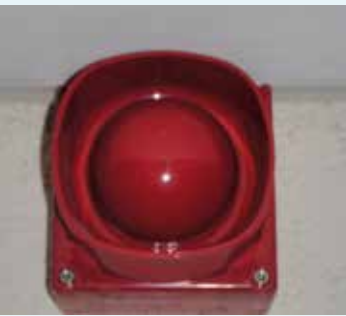
Slow whoop (brandmelder)

Bedrijfs hulpverlening gevolgd, inclusief de daarbij behorende verplichte herhalingen, met de nodige aandacht voor brand en brandpreventie.