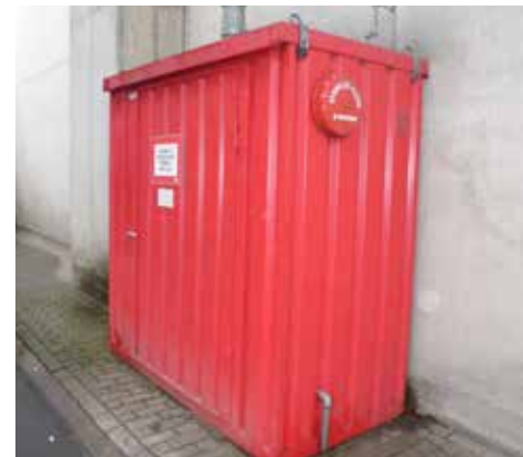
Sprinklerinstallatie (interieur en exterieur)

diens aangewezen plaatsvervanger verzorgt in principe de externe communicatie, tenzij dit met betrokken overheden of hulpdiensten anders wordt afgesproken. Bij een grotere calamiteit vervult naast de dienstdoende Officier van Dienst van de brandweer ook de burgemeester van de gemeente Beuningen een belangrijke rol. Zodra de brandweer ter plaatse is, neemt de Officier van dienst van de Veiligheidsregio (OvD) bij het bestrijden van de calamiteit de algehele operationele leiding over van de betrokken ARN-medewerkers.