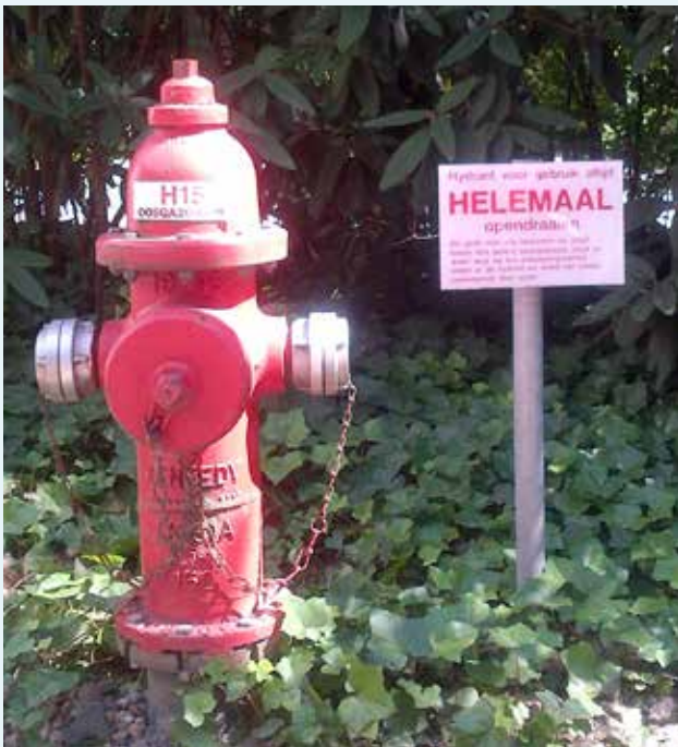
Een van de hydranten op ons terrein

name gekeken naar de oorzaak van de calamiteit, of deze ook bij andere verzekerde bedrijven zou kunnen plaatsvinden en hoe deze is te voorkomen. FM Global heeft vele deskundige engineers (technici) in dienst, die bij toerbeurt jaarlijks alle installaties van de verzekerde bedrijven bezoeken en ook in de praktijk controleren of alles up-to-date is en of de veiligheidsvoorzieningen goed functioneren. Hiervan worden protocollen en rapportages opgesteld. Op basis hiervan heeft ARN de afgelopen 10 jaar aanvullend op de oorspronkelijke investeringen, ruim € 3 miljoen geïnvesteerd in diverse preventieve maatregelen en voorzieningen. Voorbeelden hiervan zijn de installatie van een zeer geavanceerde brandmeldcentrale, detectieapparatuur en aanvullende