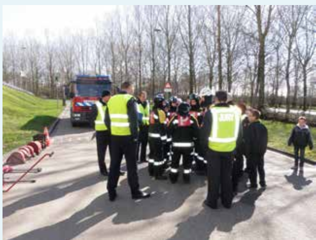
De jeugdbandweer neemt deel aan een wedstrijd op ons terrein

ARN beschikt over een zeer omvangrijk op schrift gesteld bedrijfsnoodplan. Hierin staan alle mogelijke en denkbare calamiteiten beschreven die op ons terrein of in de installaties zouden kunnen optreden. Per calamiteit staat uitvoerig beschreven welke actie moet worden ondernomen om de calamiteit effectief te bestrijden en overlast naar de omgeving en het milieu zoveel mogelijk te voorkomen. Dit plan is overigens, conform onze vergunningsvoorschriften, uitdrukkelijk goedgekeurd door de regionale brandweer, de Omgevingsdienst Regio Nijmegen (namens Provincie Gelderland) en door Waterschap Rivierenland.